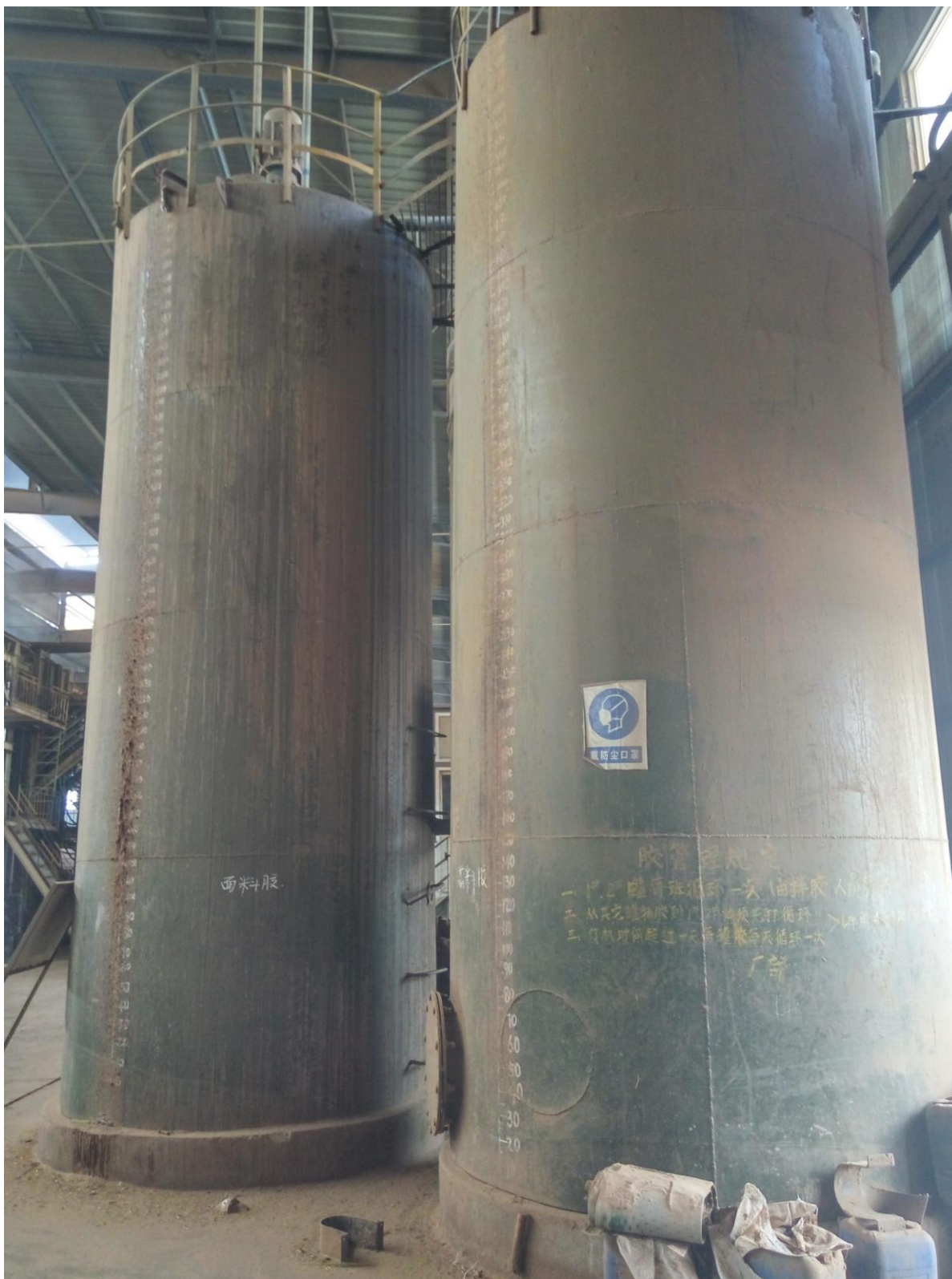
脲醛树脂胶应急罐